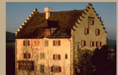
Das 700 Jahre alte, historische Schloss Greifensee.